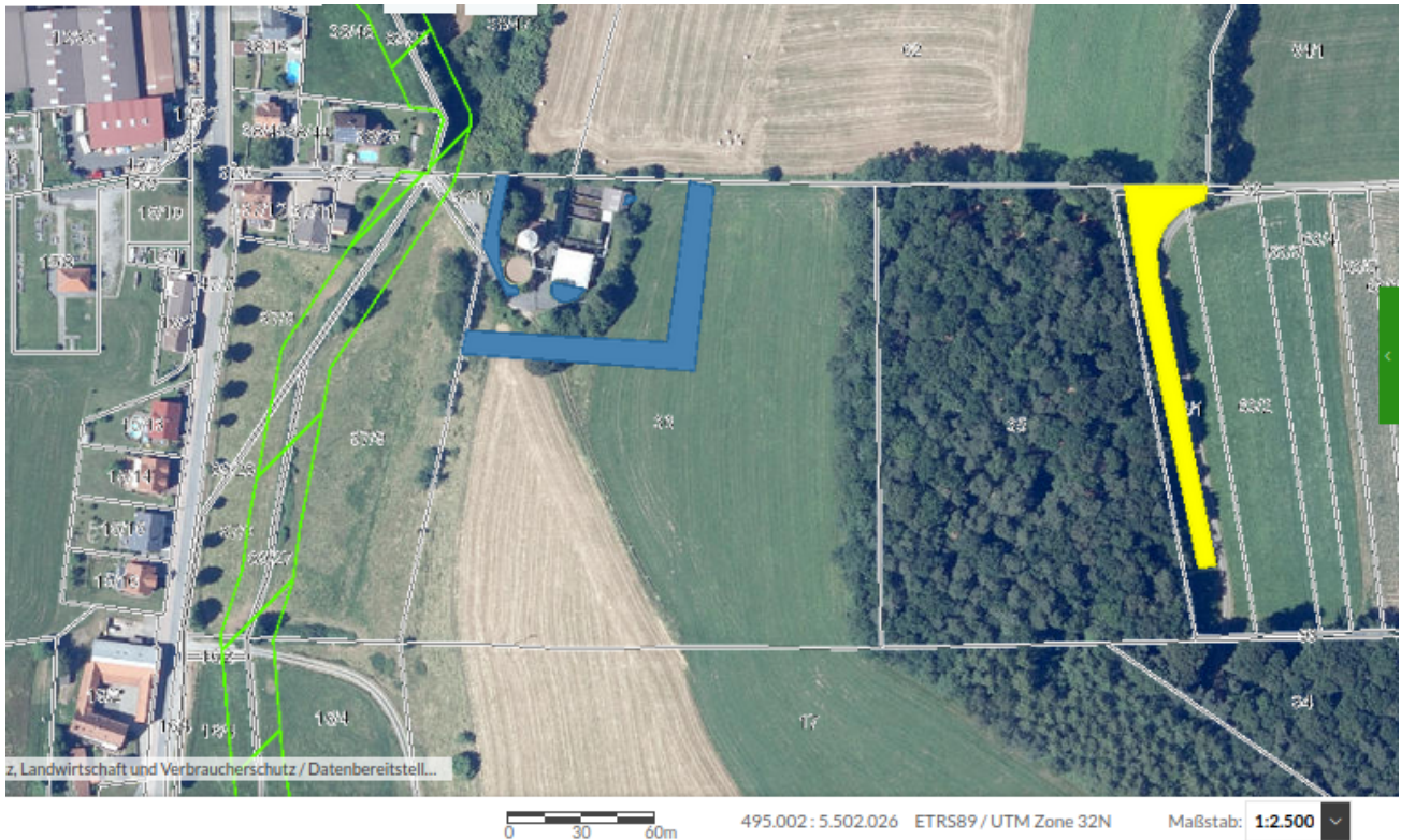
Luftbild (2019) mit FFH-Gebiet und Kompensationsflächen